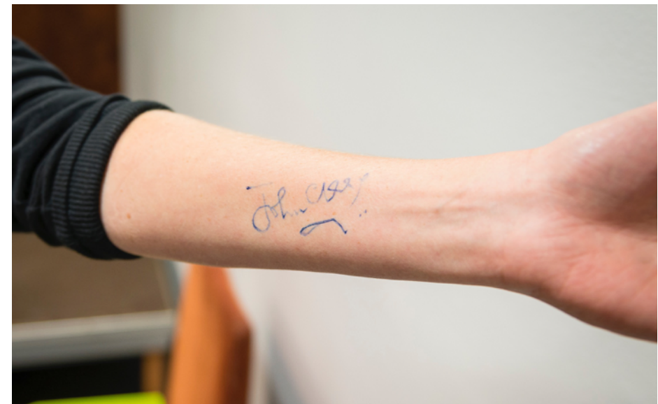
Es waren keine Bücher mehr da, da liess sich dieser junge Mann den Arm von John Cleese signieren.