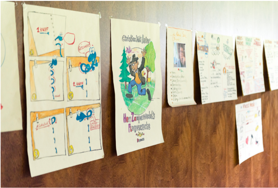
Bücher machen – einfach erklärt