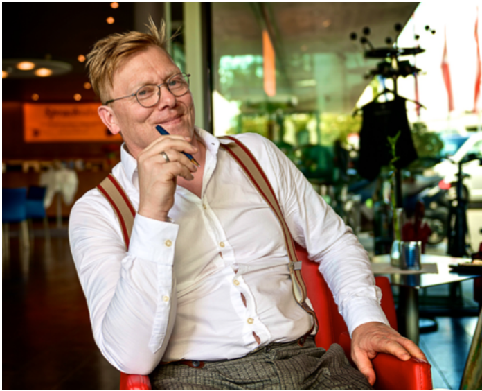
Jon Gnarr verschmitzt