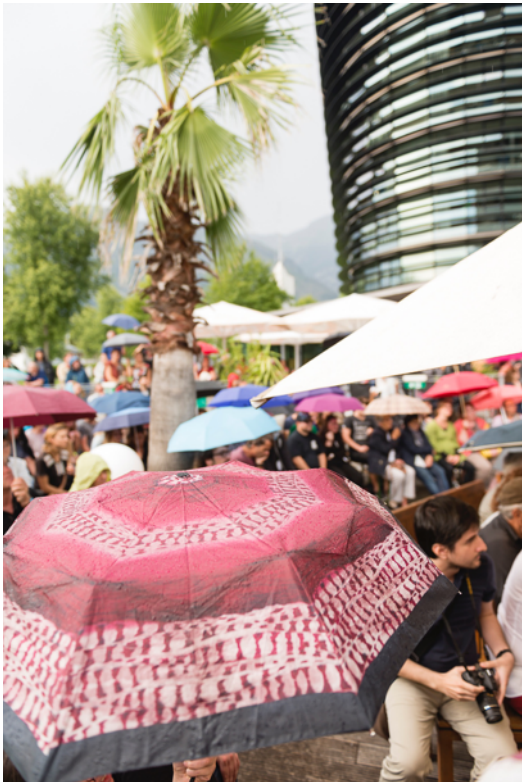
Das bisschen Regen konnte niemanden von der Terrasse vertreiben