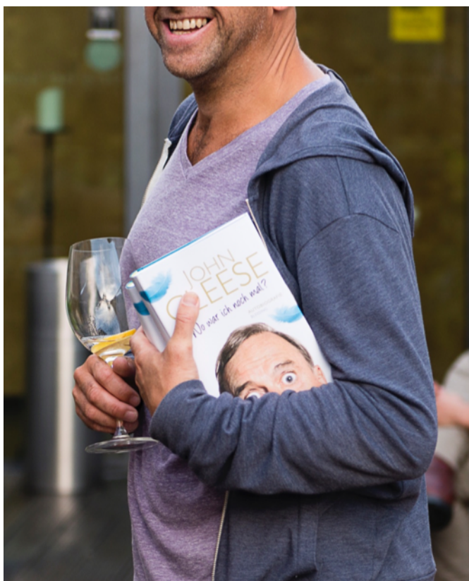
So voll war die Parkhotel Terrasse wohl noch nie! Und alles wegen ihm – John Cleese....