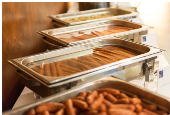
Kulinarischer Empfang mit typischen «Würstln» aus Tirol: die Haller Stadt lockt mit seiner mittelalterlichen Kulisse.