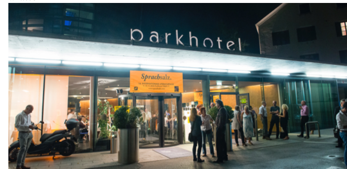
Ein Fest bis tief in die Nacht.