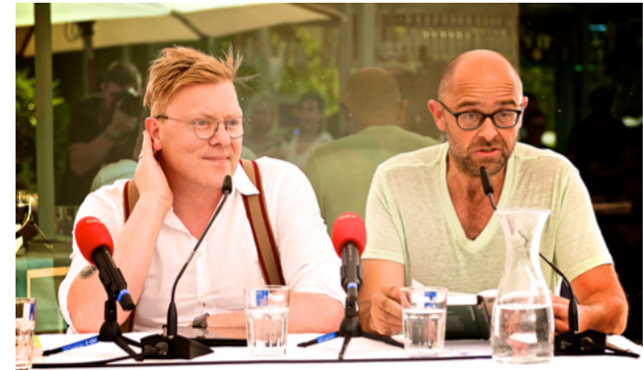
Einer der Stars des Festivals: Der Isländer Jón Gnarr