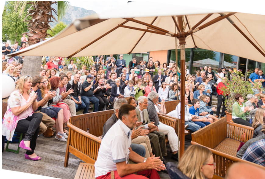
Denn schliesslich warteten alle genannt auf...